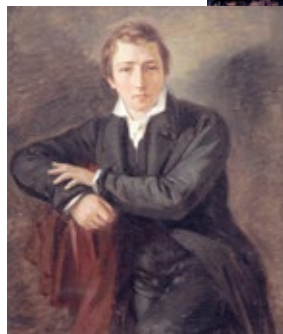
◀ Gemälde von M. D. Oppenheim