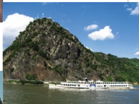
▼ Der Loreley-Felsen